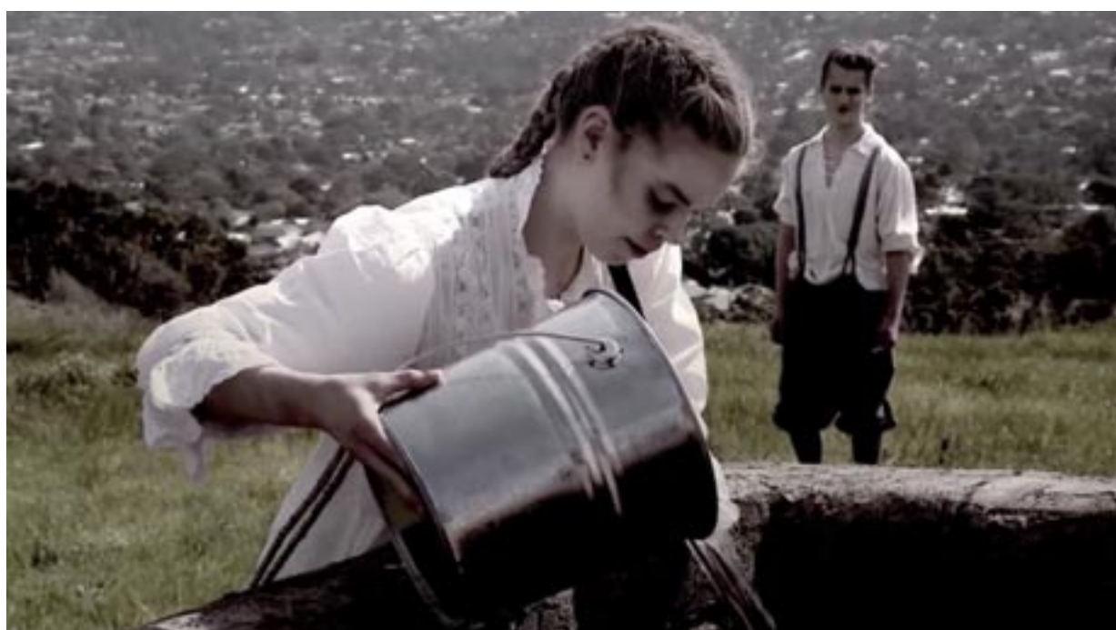
Jack & Jill